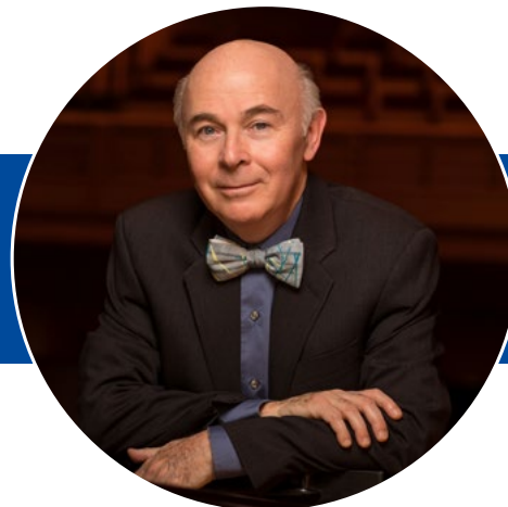
JORGE FEDERICO OSORIO Piano

Jorge Federico Osorio ha sido alabado en el mundo por su musicalidad suprema, técnica poderosa, vibrante imaginación y profunda pasión. Ha recibido varios premios y galardones internacionales que incluyen la prestigiosa Medalla Bellas Artes, el más alto honor conferido por el Instituto Nacional de Bellas Artes en México. Se ha presentado con algunas de las más prestigias orquestas del mundo dirigido por Frühbeck de Burgos, Haitink, Jansons, Maazel y Tennstedt, entre otros. Sus giras lo han llevado a Asia, todo el continente americano y Europa. Tocó el ciclo Beethoven con la Sinfónica de Atlanta dirigido por Robert Spano y Roberto Abbado, y con la Sinfónica de Chicago y James Conlon. Recientemente inauguró la sala de conciertos de la Universidad de Costa Rica y debutó en Los Ángeles, California. Como camerista ha tocado en trío con la violinista Mayumi Fujikawa y el chelista Richard Markson y ha colaborado con Yo-Yo Ma, Ani Kavafian, Elmar Oliveira y Henryk Szeryng.